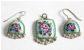
НМПТ «Ростовская финифть»